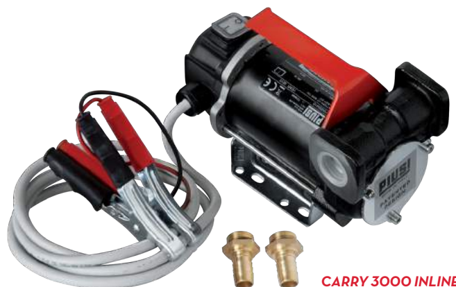
CARRY 3000 INLINE